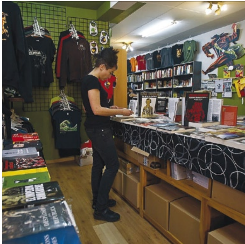
Comercio en el barrio de Sants.

“Siempre partimos de un análisis económico de la empresa”, analiza Bover. “Identificamos sus puntos débiles, los valoramos y ofrecemos las soluciones más adecuadas, con el objetivo de aumentar su eficacia y eficiencia. Buscamos, por ejemplo, la manera de minimizar los efectos de una decisión errónea o de evitar que se produzcan despilfarros que, hoy más que nunca, pueden resultar fatales en una cuenta de resultados”, resume.