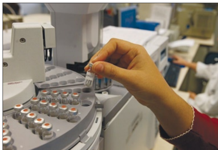
Análisis de una muestra en un laboratorio de Barcelona.

En este sentido, de los 22 centros que optan al distintivo de excelencia Severo Ochoa –que identifica a los mejores del mundo en su especialidad–, 12 son catalanes. Se trata del Supercomputing Center-Centro Nacional de Supercomputación; el Instituto de Ciencias Fotónicas; el