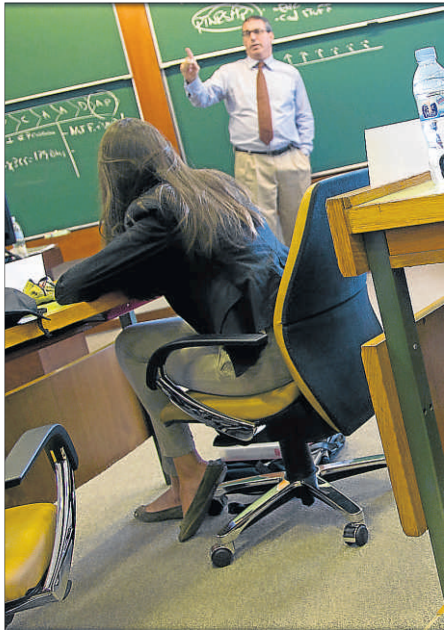
Un aula de la Summer School del Iese esta semana

En los últimos años Catalunya se ha consolidado como uno de los destinos más solicitados para estudiar durante una temporada. Se estima que más de 24.000 estudiantes extranjeros llegaron hasta aquí el pasado año para cursar algún programa universitario o bien de una escuela de negocio. Según un estudio elaborado por el Observatorio Universitario de Barcelona, el 31,3% de los estudiantes de tercer ciclo en Catalunya son extranjeros, mientras que el 21,5% de los estudiantes de primer y segundo ciclo también lo son. El mismo estudio, apunta que este colectivo genera unos 24,5 millones anuales de ingresos en la ciudad. En esta línea, el pasado curso 2009-2010, la UAB se coronó como la primera universidad catalana y la sexta de Europa en cuanto a número de estudiantes Erasmus recibidos, con 1.154 estudiantes.